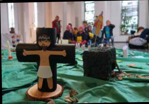
Kinder-Karwoche rund um die Elisabethkirche