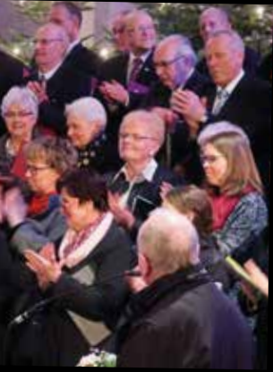
n der Elisabethkirche