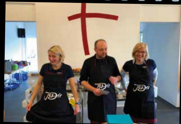
Osterlager der JoDis im Haus Aurora / Sauerland