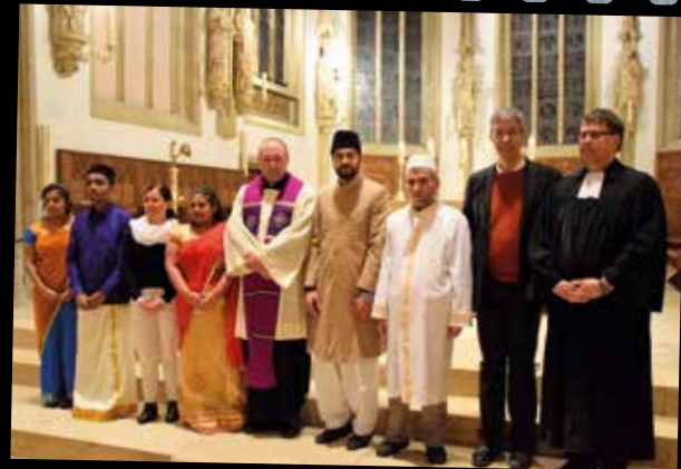
interreligiöses Friedensgebet „suche Frieden“ in St. Dionysius