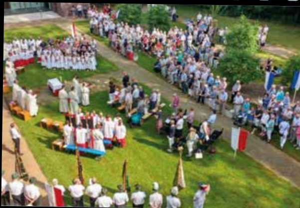
Fronleichnam: Gottesdienst am Gertrudenstift und Prozession an der Salzbergener Straße