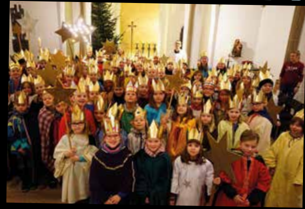
Aussendungsgottesdienst der Sternsinger - JoDis