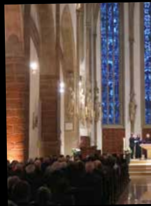
Orgelweihe der erweiterten und erneuerten Orgel und Konzert in der Dionysiuskirche am 11. März 2018