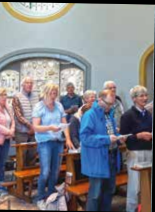
fahrt nach Telgte