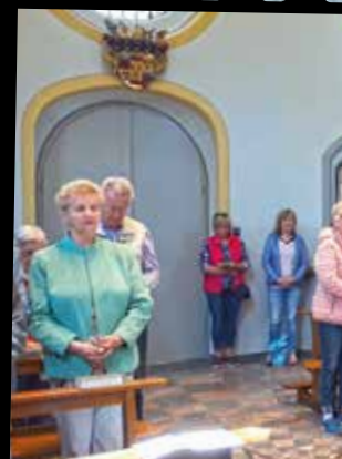
5. Mai: Radwal