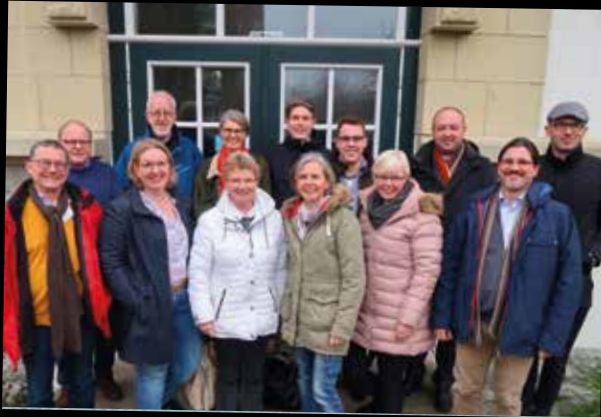
Klausurtagung des neu gewählten Pfarreirates