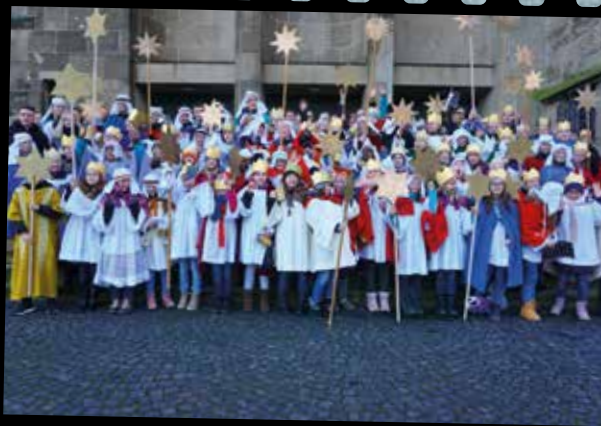
Sternsinger - Elisabethkirche