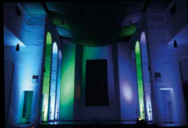
Gründonnerstag in St. Elisabeth - bes. Gestaltung der Liturgie